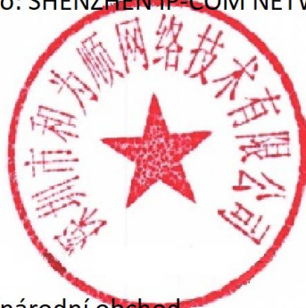
Zhou Jun Obchodní manažer por mezinárodní obchod