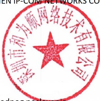
Zhou Jun Menadžer prodaje međunarodnog poslovanja